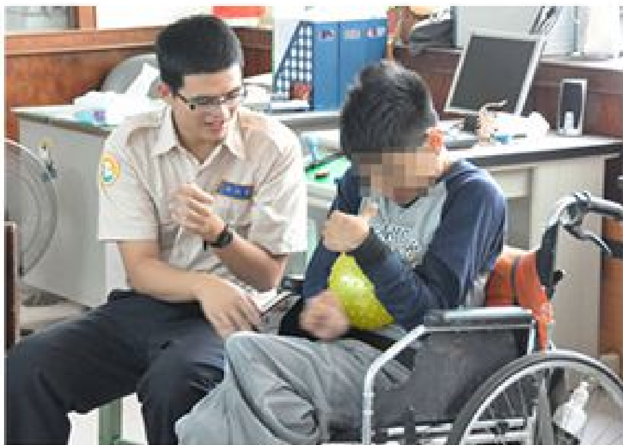
攝影組佳作 簡筆 林永豪

價值。我讓他看見自己的力量；他則使我見到服務帶給人的神奇改變，小小的舉動帶給人們大大的力量。替代役不只是盡國家義務而已，更是以另一種形式守護著這片土地上的人民，我們是滴水，卻一點一滴流向社會上每個需要的角落，灌溉了心田，長出美麗的笑容。我背著菊島的夕陽，挺著肩上的臂章，讓這股快樂泉源繼續在菊島蔓延著。