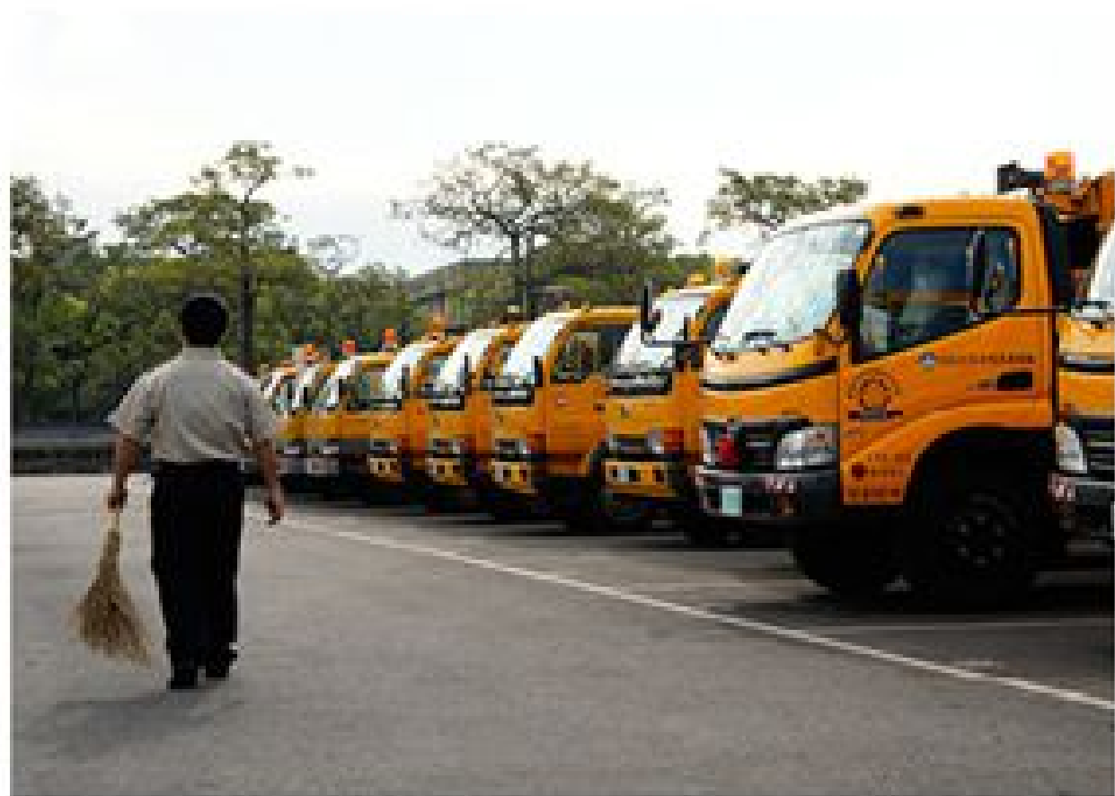
攝影組佳作 環保役 柯克

替代役生活要怎麼過，要做烙印在人內心的「爽兵」，還是不帶走一片雲彩的「爽兵」？價值，由自己決定。