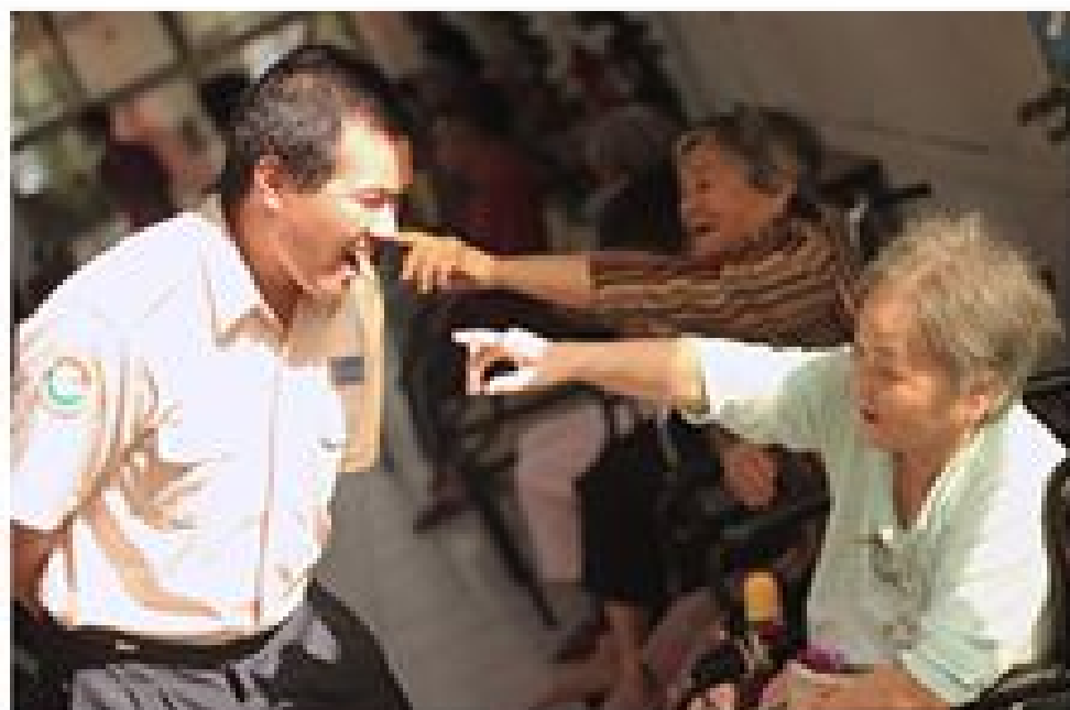
攝影組佳作 方向 黃煒智

乎真的比較省力，後來還陸續學會對個案的神奇穿衣法、快速調整個案在輪椅上的坐姿等技巧，如果當需要使用的時候似乎會比較方便與省時。每天運用空閒時間協助個案做復健，時間算是十分充裕，所以可以看到個案的逐漸進步。