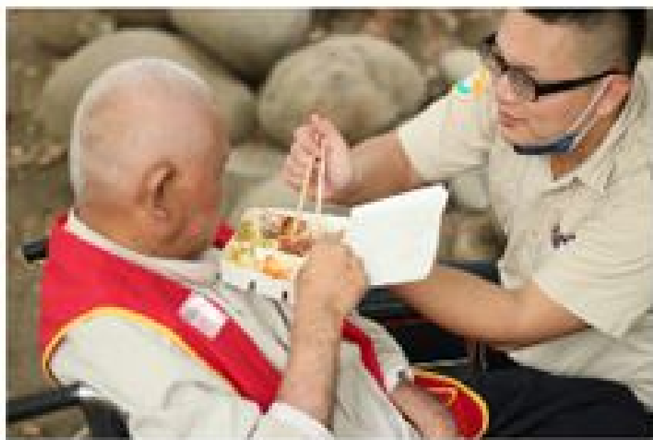
攝影組佳作 關懷榮 民長輩

我們真的很努力，並且，我們對國家的愛並不亞於任何人。雖然，要所有替代役男們重拾自己的榮譽心並不是件易事，與整個社會相比，我們是如此渺小且微不足道，但相信只要我們替代役都能盡己所能去散發光芒，照亮這個社會，我們必將能夠以最正面的心態把國家的未來導向一個嶄新並充滿愛與關懷的時代。