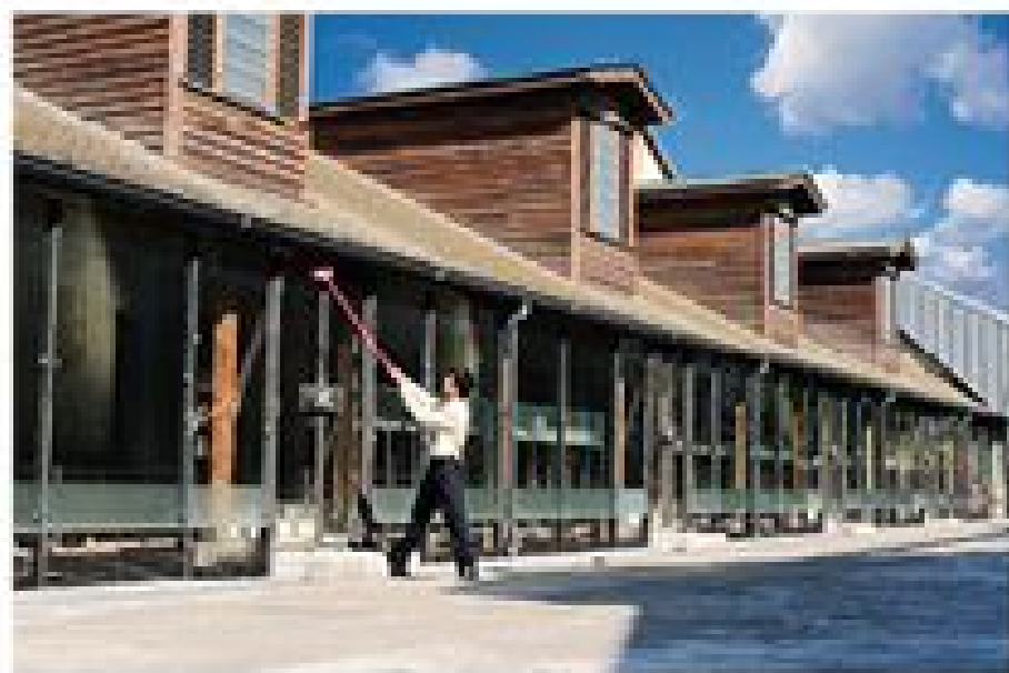
攝影組佳作 掃出好門面 陳奕捷

人。」每一本書、每一齣電影都是我的好朋友，每日的圖書工作就像在浩瀚的書林片影中與朋友吟嘯徐行，途中我與九把刀一同品聞愛情花草，分享著各自那些年的種種；想遊憩的時候，就和美國大作家蘇珊科林斯玩《飢餓遊戲》，體會叢林間的生存法則；累了就在村上春樹下休息，開著《村上收音機》，聆聽著文學世界的靜謐。森林裡臥虎藏龍，有時可以和李慕白切磋劍術，在收放之間，體會人生哲理；有時可以跟印第安那瓊斯一同在密林中冒險，在驚心動魄的追尋中，找尋自己生命中的夢奇地；更可以跟哈利波特在樹林中騎著掃帚競速，比賽著傳說中的魁第奇，學習團隊合作的默契。