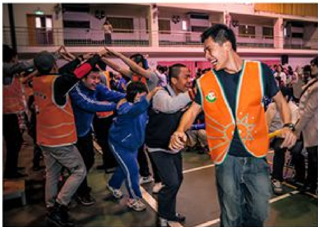
攝影組佳作 火車火車過山斜 苗天雨

離去前，傑夫問我：「你在這裡，是擔任什麼職務？」我挺起胸膛，自豪地說出我在此的緣由，以及應盡的義務和職責。「我是替代役，在新竹市監理站擔任交通助理，很高興為您服務！」